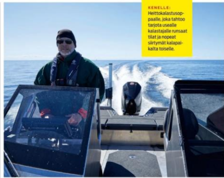
KEHELLE: Heittokalastusop- paalle, joka lahtoo tarjota osalle kalastajalle runsaat tilat ja nopeat siirtymät kalapaik- kailta toiselle.

Toinen yritys Elokuvassa Unan venenytytyyn aikaan tuli toinen tilaisuus ajaa Aaltomarinella, ja nyt ihan oi- keita aaltoja päin. Näkemys ve- neen jykyydestä ei muuttunut. Aika meriseen aaltoon saat- toi edelleen ajaa suunnilleen niin kovaa kuin laite kulkee – ja hämmästelä hiihtausuutta. Mi- kään ei koloussut, nitissyt rämsi- syt tai edes paukkua Aaltomari- n. Kun ulompansa aalloit sitten kasvoivat enimmillään noin puoleentoista metrin, teki mieli jo vähän hiltä vauhtia. Ja silloin alkoi vesi lentää, myös silmille.