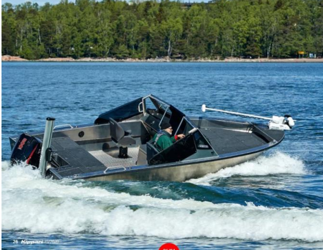
20 Kippari 10/2020